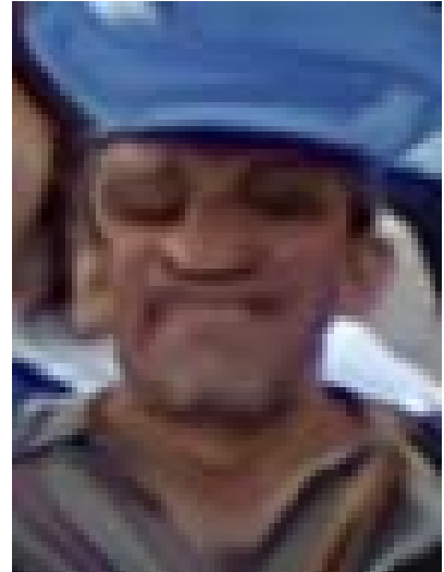
Soluzione del numero scorso BELLISSIMO !!!!!!!